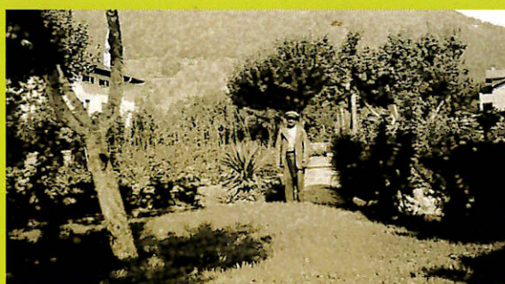
Un ricoverato che edempie le funzioni di giardiniere

Nel 1948 ci fu il primo ampliamento aggiungendo un'ala con due piani e seminterrato. La ristrutturazione permise di aumentare il numero degli ospiti fino a un centinaio. Fu in quell'occasione che al primo piano venne inserita la chiesa dedicata a San Giuseppe.