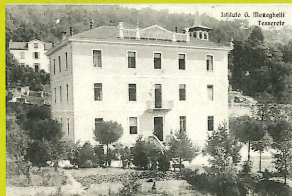
Istituto G. Meneghelli Tesserete