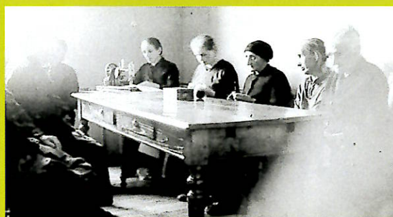
La sala da lavoro per le ricoverate