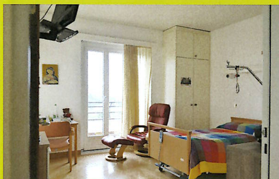
Camera con balcone