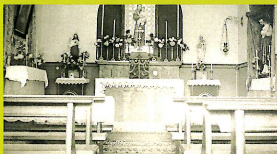
La devota cappellina, dedicata a San Giuseppe