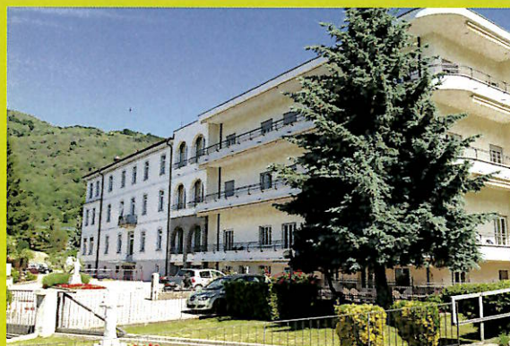
Casa San Giuseppe

Oggi la comunità religiosa è composta da cinque suore di cui tre figurano nell'organico che conta 61 operatori. Collaborano volontari e amici che si trovano a svolgere un ruolo prezioso a favore delle persone anziane che necessitano di essere accolte e accompagnate. La casa San Giuseppe in Tesserete vive la sua opera col "Carisma Guanelliano" che la contraddistingue. I residenti vivono una quotidianità serena e familiare con cure di buona qualità. Ottimo il servizio cucina, l'ergoterapia, fisioterapia, servizio alberghiero e manutenzione oltre alle attività occupazionali che quotidianamente vengono supportate dalle volontarie che abitano sul territorio Capriaschese.