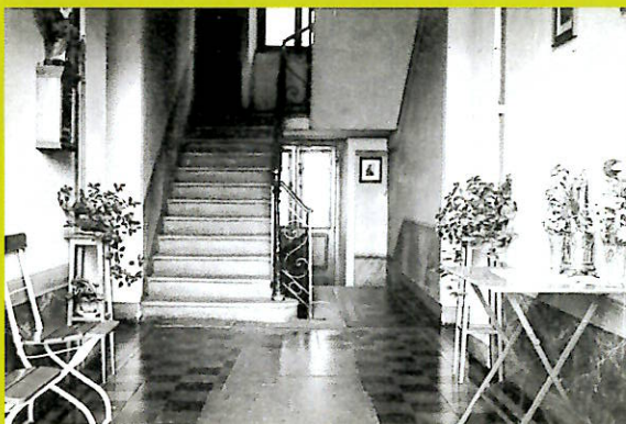
Atrio ingresso 1934