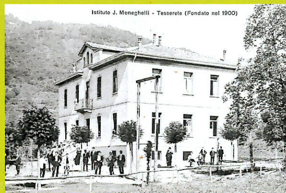
Istituto J. Meneghelli - Tesserete (Fondato nel 1900)

Nel 1932 la "Fondazione Ospedale Ricovero" venne affidata alle religiose della "Divina Provvidenza di San Jodoco" di Baldegg che però dovettero ritirarsi dopo due anni.