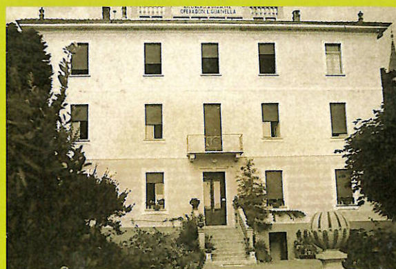
Il fiorito ed invitante ingresso principale