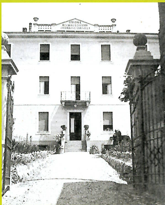
L'Istituto, a mezzodi, visto dal viale d'accesso

L'opera Guanelliana comincia la sua espansione a Como nel 1882, si diffonde rapidamente in varie parti d'Italia e in Svizzera; Roveredo Grigioni, Capolago, Castel San Pietro, Valle Maggia e Tesserete. Dopo la morte del fondatore le opere di carità si sono moltiplicate. Attualmente l'opera è presente in 20 nazioni dei quattro continenti: Europa, America, Asia, e Africa.