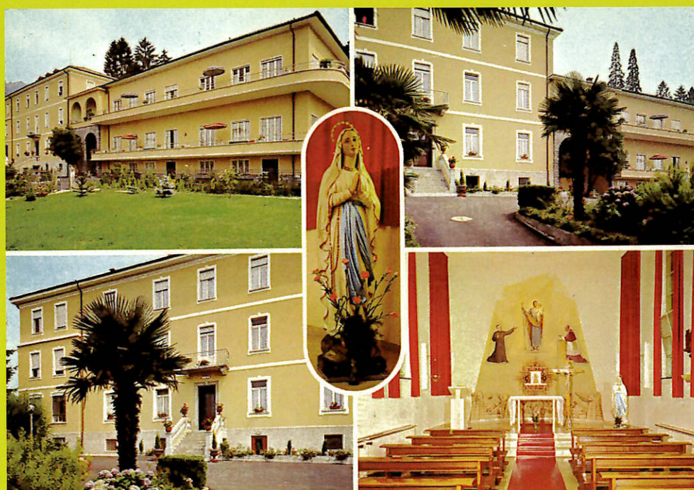
Cartolina del 1980 casa anziani nuova ristrutturazione