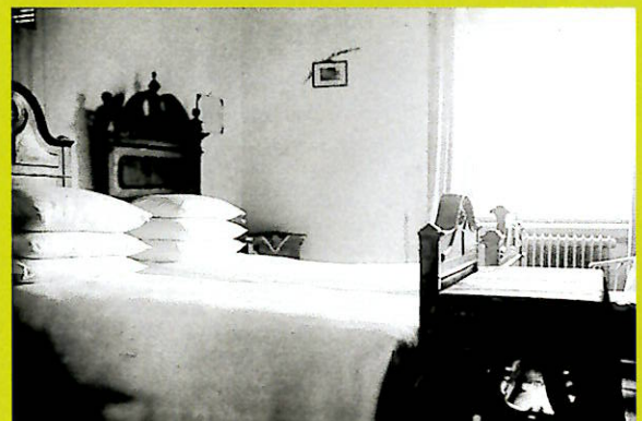
Camera a due letti