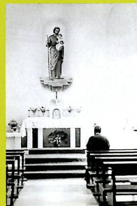
Chiesa di S. Giuseppe 1958