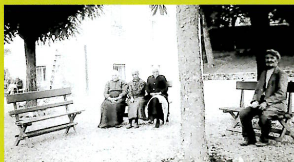
La siesta dei ricoverati, un angolo tranquillo