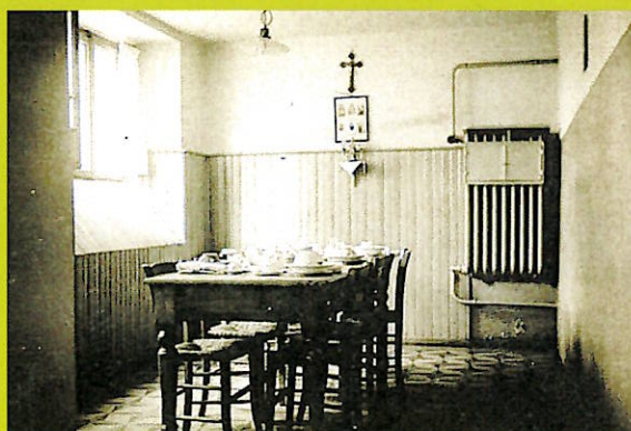
Il raccolto refettorio Suore

Dopo circa dodici anni di servizio ospedaliero la casa S. Giuseppe divenne unicamente ricovero per le persone anziane. Continuava però il servizio maternità, alcune camere erano state riservate per questo scopo dal 1934. Molti dei nostri attuali ospiti sono nati o hanno partorito nella Casa S. Giuseppe.